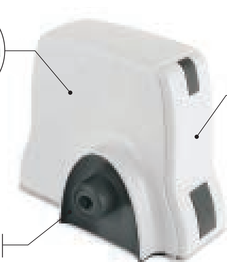
CORPO IN ALLUMINIO VERNICIATO