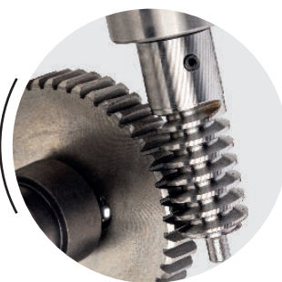
INGRANAGGI IN ACCIAIO