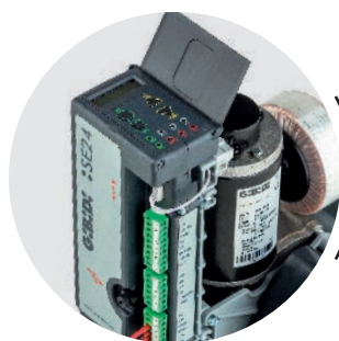
CENTRALE DI COMANDO INCORPORATA

Con il kit batterie (opzionale) installato nel motore, apertura e chiusura anche in caso di black-out.