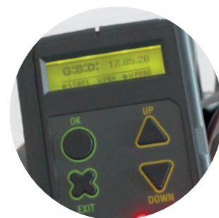
DISPLAY GRAFICO RETROILLUMINATO