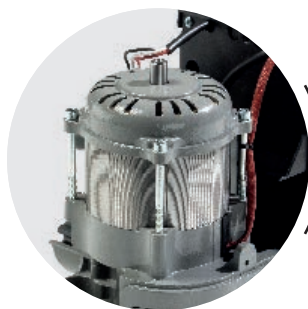
MOTORE ELETTRICO BEN DIMENSIONATO