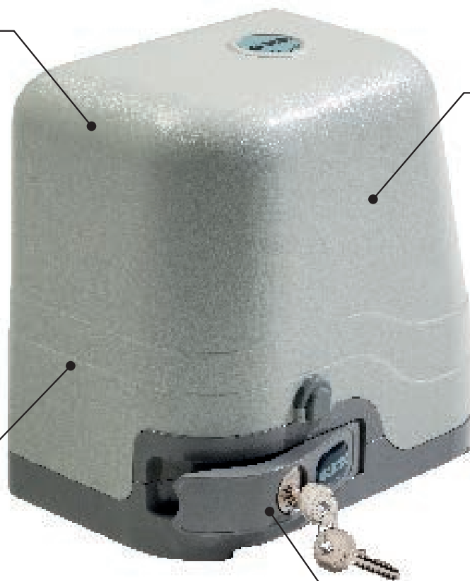
CORPO OPERATORE COMPLETAMENTE VERNICIATO