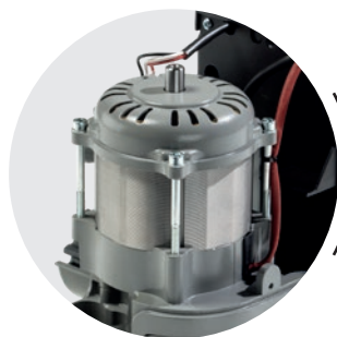
MOTEUR ÉLECTRIQUE PUISSANT