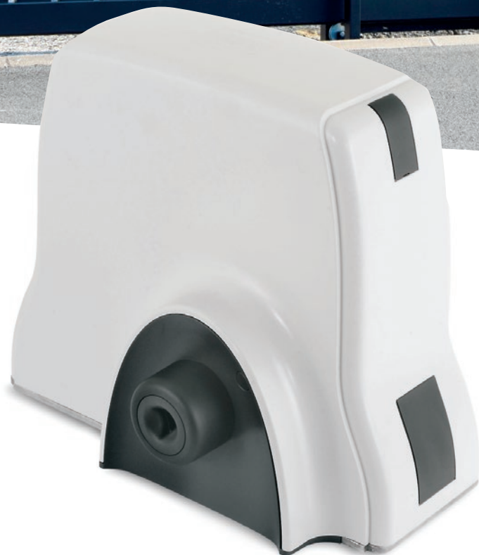
FOTO AUTOMATIC GATES