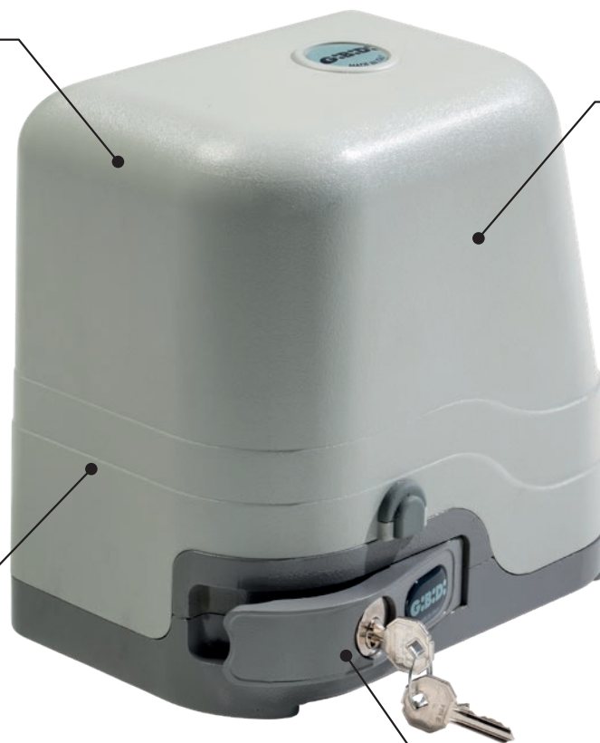
DISPOSITIVO DE DESBLOQUEO MANUAL CON LLAVE PERSONALIZADA