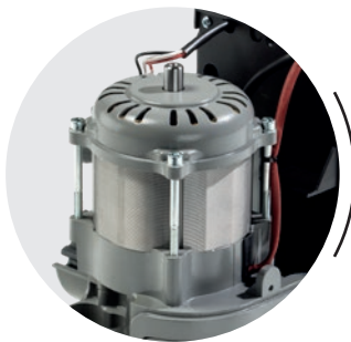
POTENTE MOTOR ELECTRICO