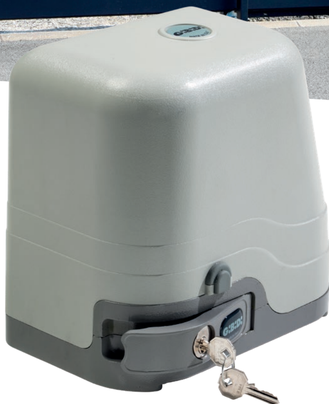
FOTO AUTOMATIC GATES